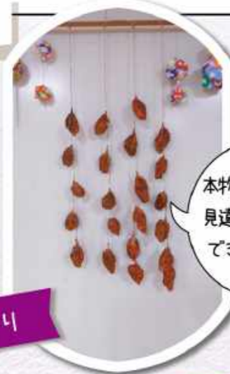
本物の干し柿と見違ふくらいのでき映えです。