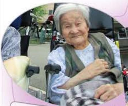
お神輿をみんなで見た後、天気の中おやつを食べました。