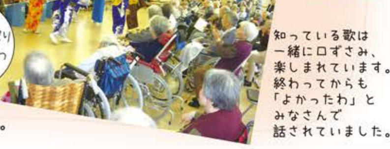
知っている歌は一緒に口ずさみ、楽しんでいます。終わってからも「よかったわ」とみなさんで話されていました。