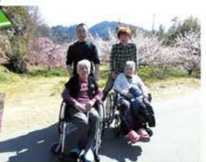
3月27日奈良の月ヶ瀬に梅を見に行きました。梅が満開でとても綺麗でまた、行きたいと言われ楽しかったです。