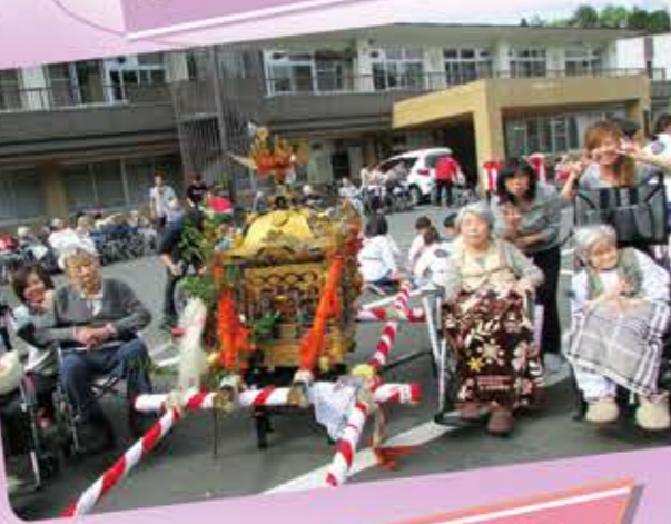
余野公園へおでかけ。みなさん、つつじを見たりと喜んでおられました。