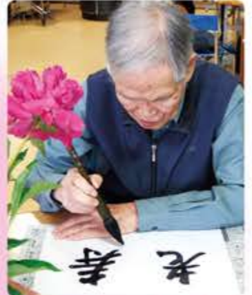
「老寿」の題字を書いて下さいました。