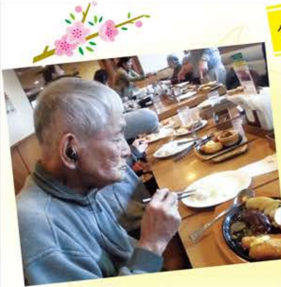
寿長生の里へ梅を見に行きました。レストランに行って、料理をお腹いっぱい頂きました。見事、みなさん完食です！