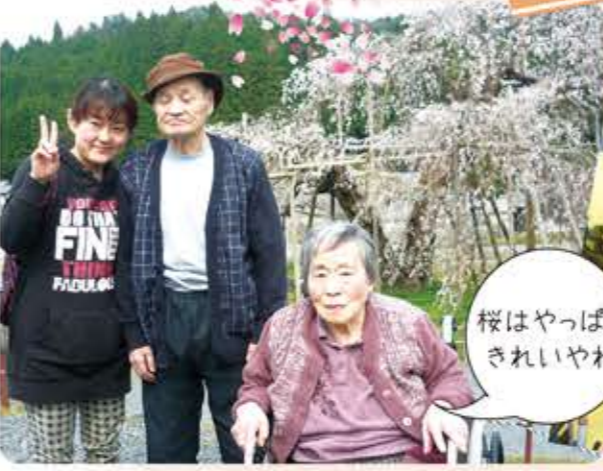
桜はやっぱりきれいやわ