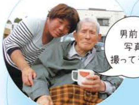
男前に写真撮ってやー