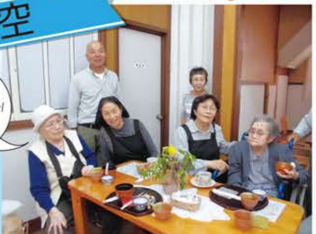
5月ぬくもり喫茶牧の里に利用者さんで行って来ました。地域の方、暖かく出迎えて頂きありがとうございます。ぜんざいを頂き「うまい」と一言あり、また「連れて行って」と言われていました。