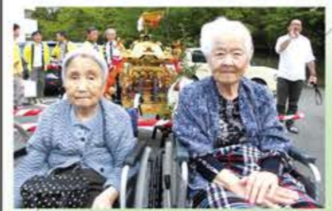
5月3日に黄瀬地区の子ども神輿を見ました！