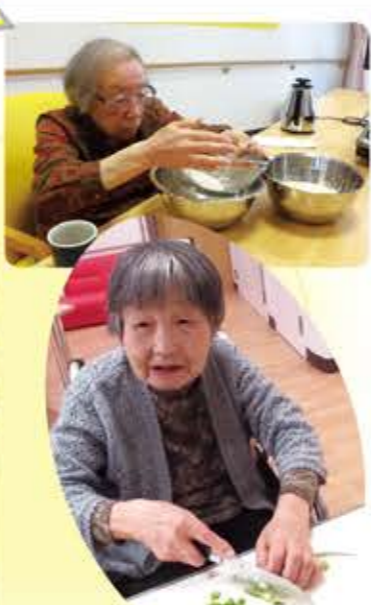
料理やおやつを作って みんなでいただきます♪