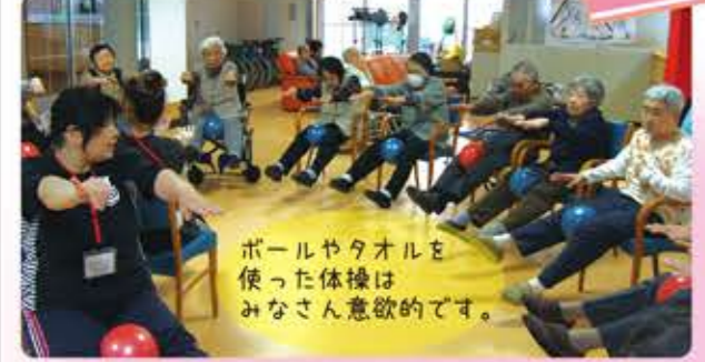
ボールやタオルを使った体操はみなさん意欲的です。